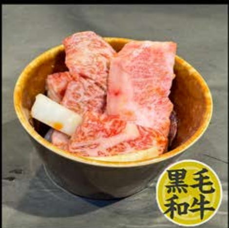
168とりどり 880円 (税込 968円)