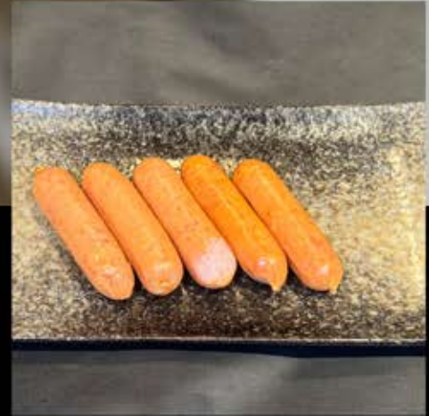
ソーセージ(5本)280円 (税込 308円)