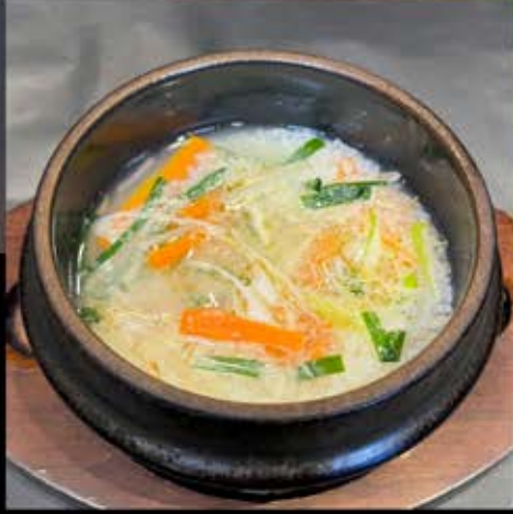
クッパ 480円 (税込 525円)