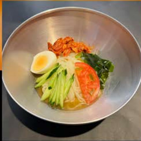
冷麺 680円 (税込 748円)