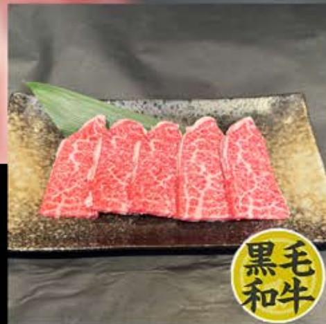
上カルビ 880円 (税込 968円)