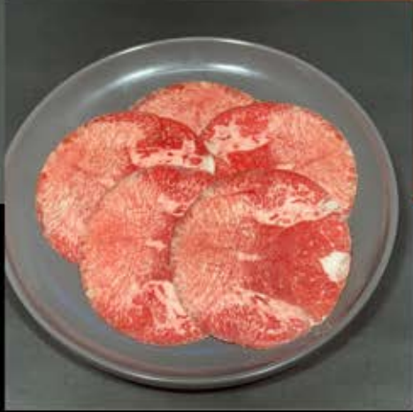
牛タン 980円 (税込 1,078円)