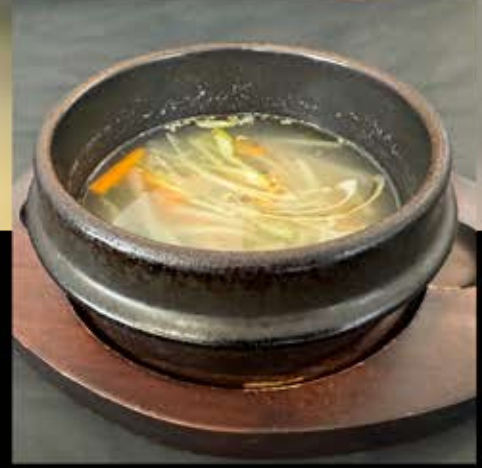
野菜スープ 380円 (税込 418円)