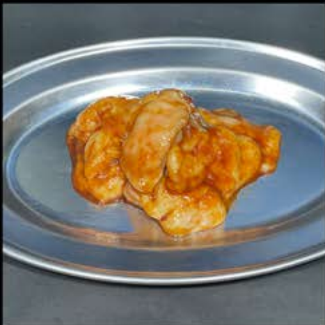
和牛ショウチョウ