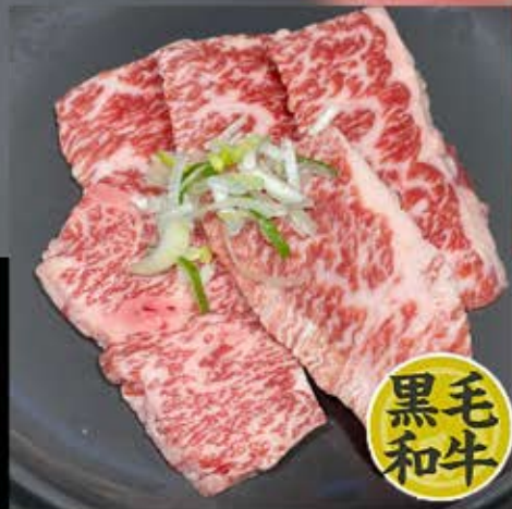
カルビ 780円 (税込 858円)