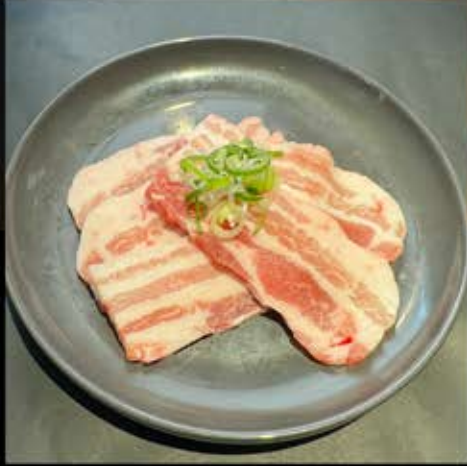
豚カルビ (もろみor塩) 480円 (税込 528円)