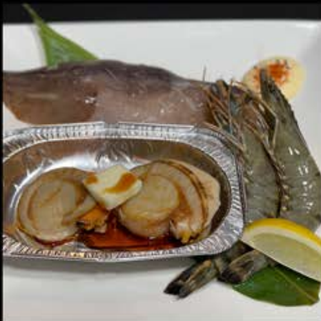
海鮮盛り 1,180円 (税込 1,298円)