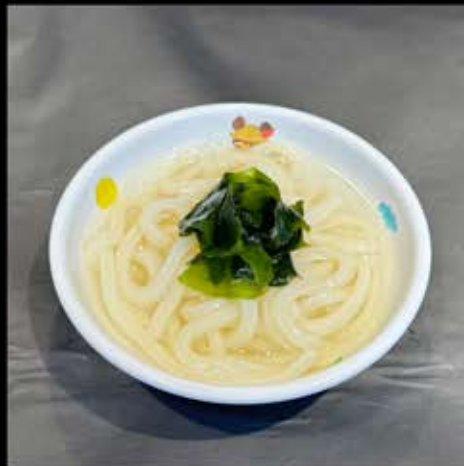
お子様うどん 280円 (税込 308円)