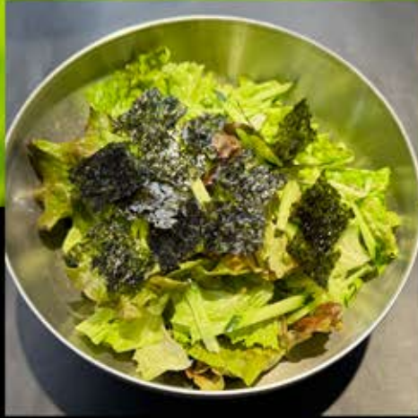
チョレギサラダ 480円 (税込 528円)