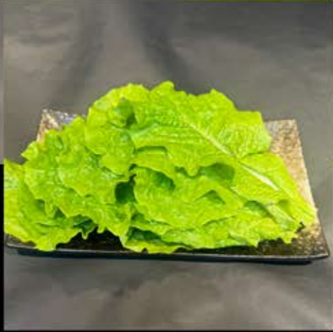
国産サンチュ 380円 (税込 418円)