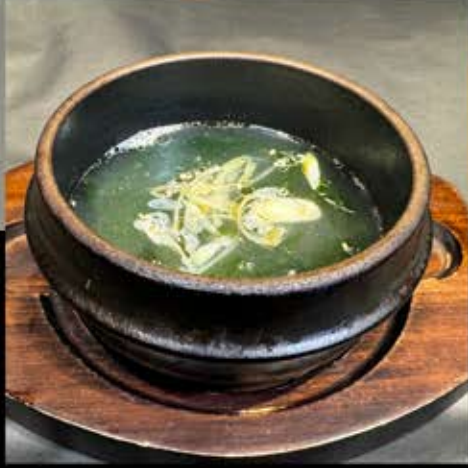
わかめスープ 380円 (税込 418円)