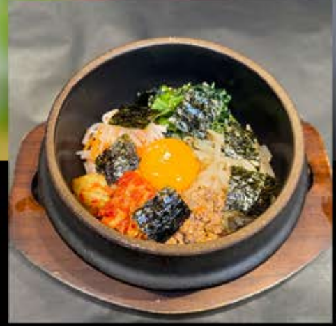
ビビンバ 630円 (税込 693円)