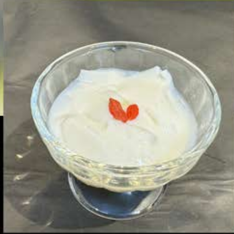
手作り杏仁豆腐 280円 (税込 308円)