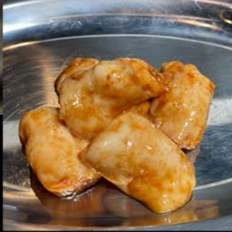
和牛マルチョウ 580円 (税込 638円)