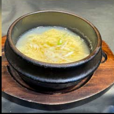
卵スープ 380円 (税込 418円)