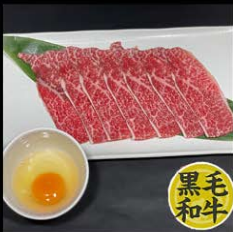
焼きしゃぶカルビ (生卵付) 780円 (税込 858円)