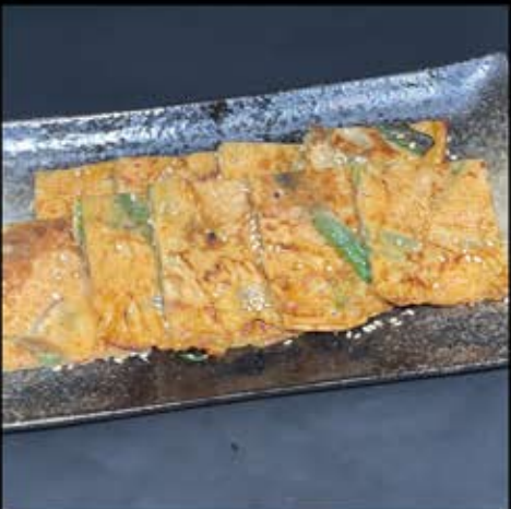
チジミ (キムチ・野菜) 380円 (税込 418円)