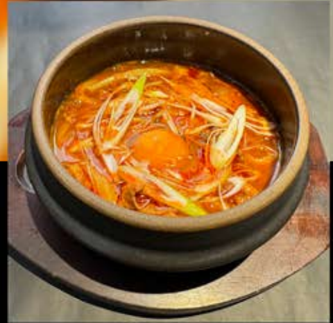
すじ煮込みうどん 730円 (税込 803円)