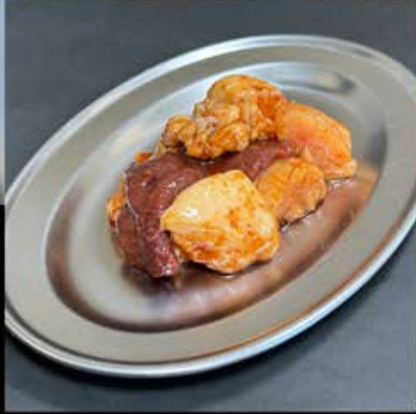
ホルモン盛合せ 880円 (税込 968円)