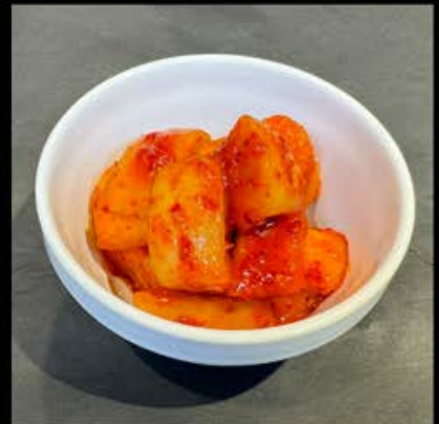
特選大根キムチ 330円 (税込 363円)