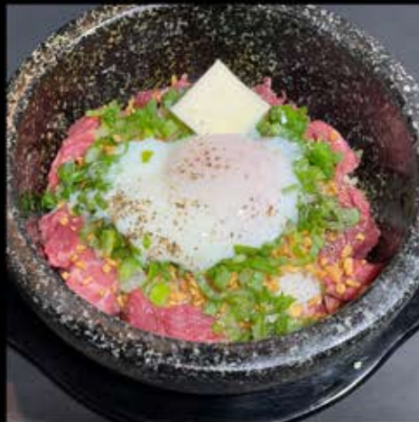
石焼ガーリックライス 730円 (税込 803円)