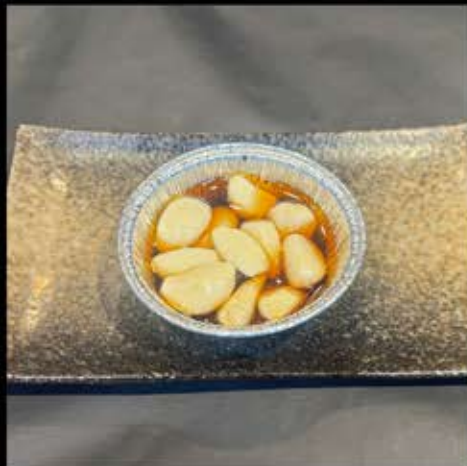
ニンニクホイル焼き 330円 (税込 363円)