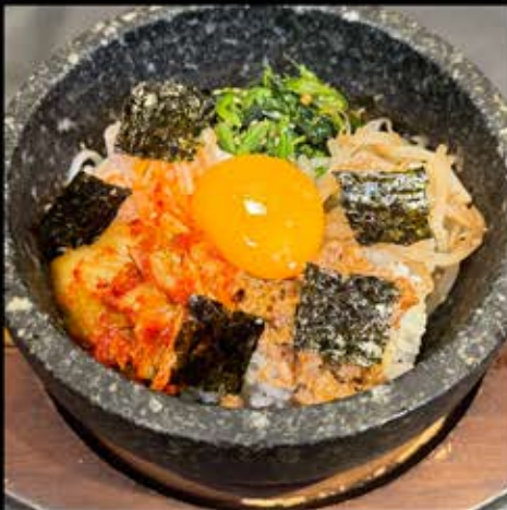
石焼ビビンバ 730円 (税込 803円)