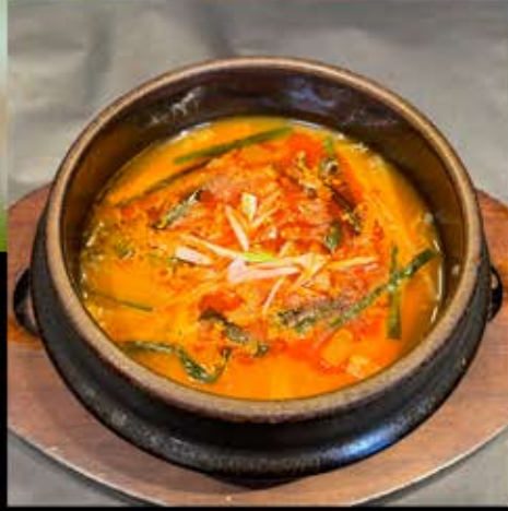
カルビクッパ 680円 (税込 748円)