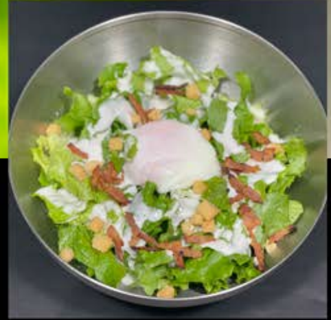
シーザーサラダ 480円 (税込 528円)