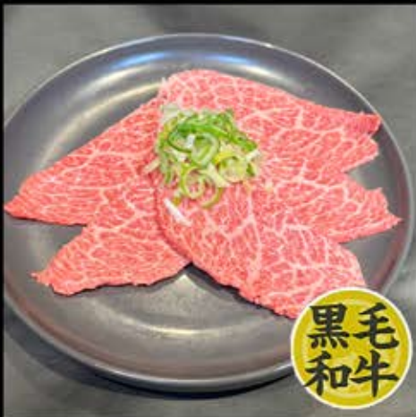
赤身肉 780円 (税込 858円)