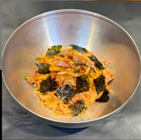
ビビン麺 680円 (税込 748円)