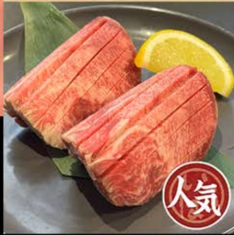
上牛タン 1,180円 (税込 1,298円)