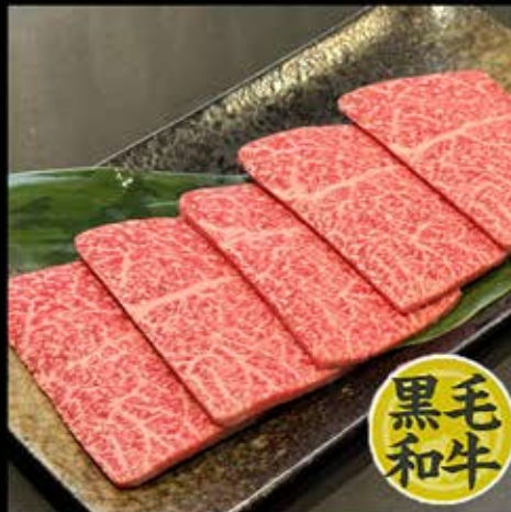
特選上赤身肉 930円 (税込 1,023円)