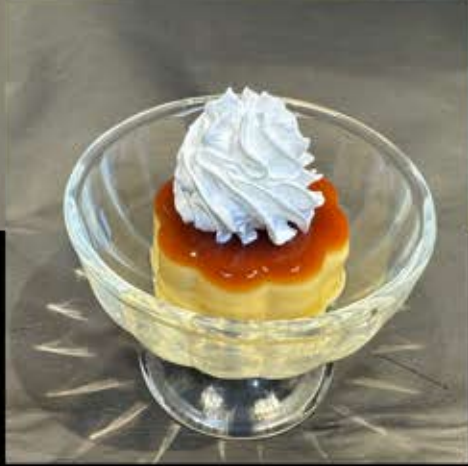
プリン 280円 (税込 308円)