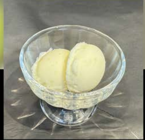
季節のシャーベット 280円 (税込 308円)