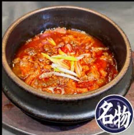
特製すじ煮込み 630円 (税込 693円)