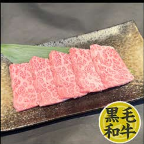
特選カルビ 980円 (税込 1,078円)