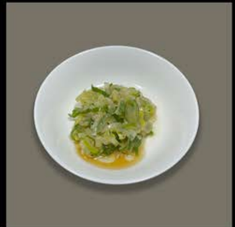
ネギ塩追加 80円 (税込 88円)