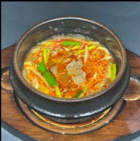
カルビスープ 580円 (税込 638円)