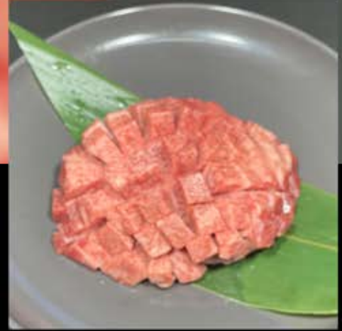
厚切りタン 1,480円 (税込 1,628円)