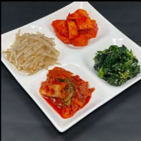
キムチ・ナムル盛合せ 580円 (税込 638円)