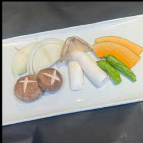
野菜盛合せ 580円 (税込 638円)