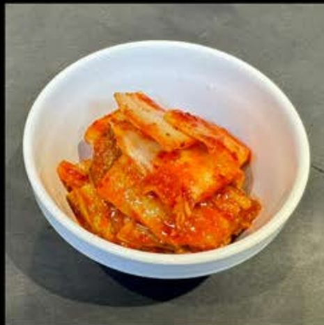
特選白菜キムチ 330円 (税込 363円)