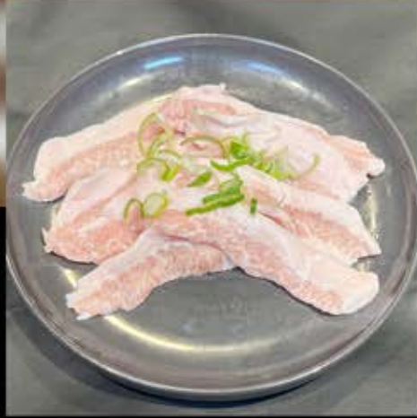
豚トロ 480円 (税込 528円)