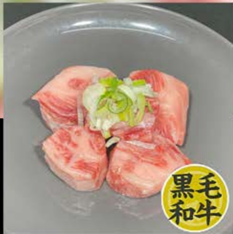
中落カルビ 780円 (税込 858円)