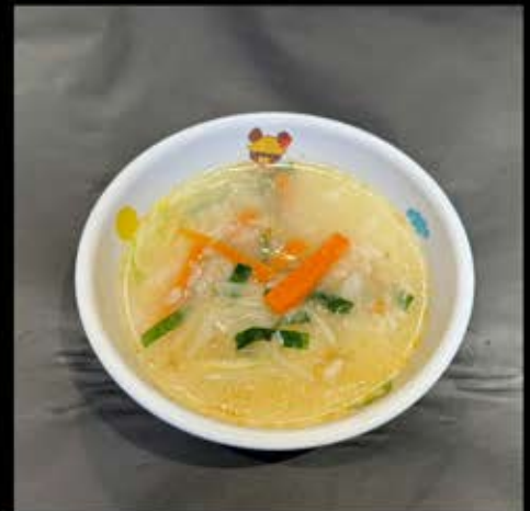
お子様クッパ 280円 (税込 308円)