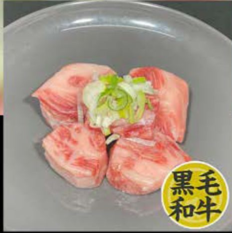
中落カルビ 780円 (税込 858円)