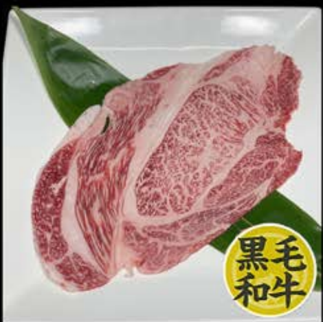
はみ出るロース 1,280円 (税込 1,408円)