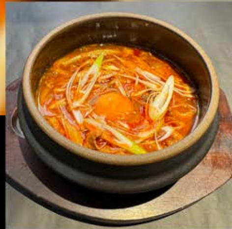
すじ煮込みうどん 730円 (税込 803円)