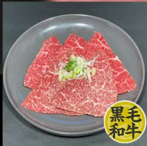
ロース 880円 (税込 968円)