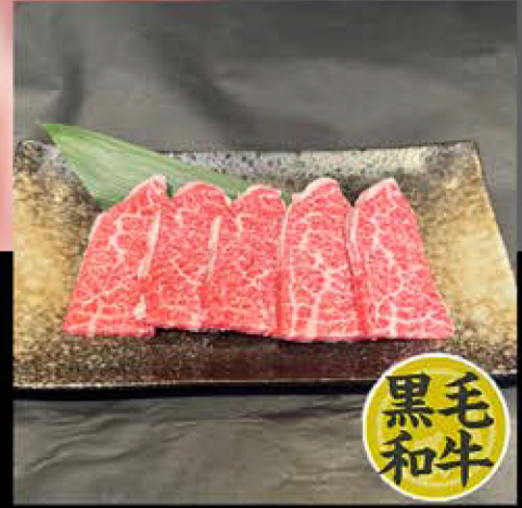
上カルビ 880円 (税込 968円)