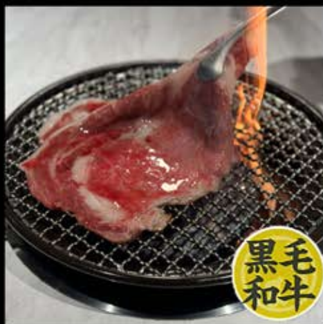
はみでるカルビ 1,280円 (税込 1,408円)