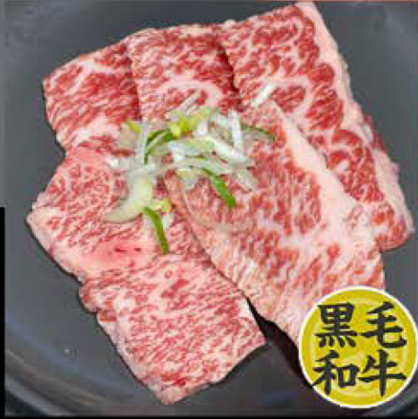
カルビ 780円 (税込 858円)