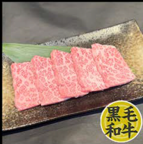
特選カルビ 980円 (税込 1,078円)