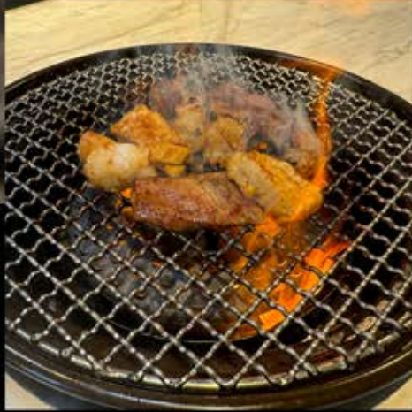
和牛マルチョウ 580円 (税込 638円)