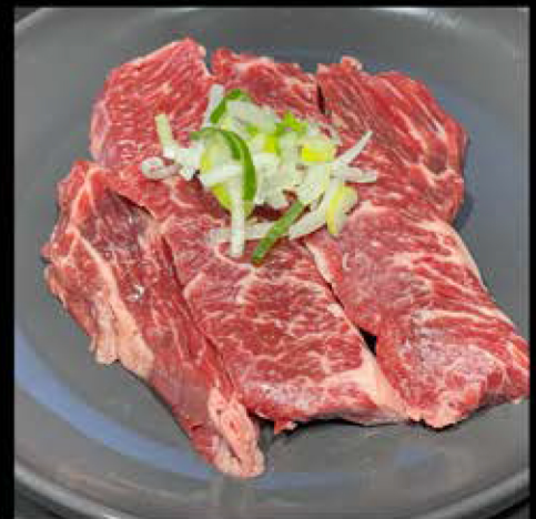
ハラミ 980円 (税込 1,078円)