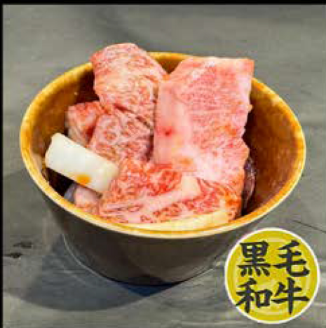
168とりどり 880円 (税込 968円)