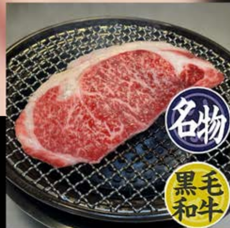
サーロインステーキ 1,280円 (税込 1,408円)