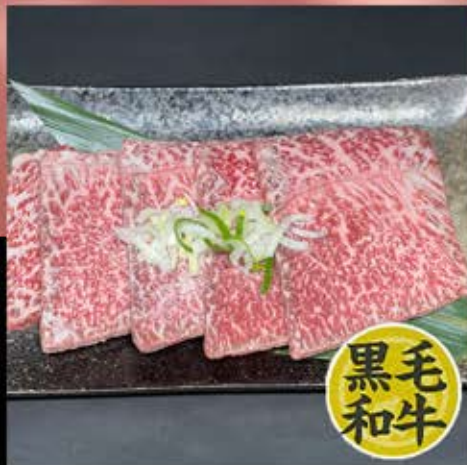
特選ロース 980円 (税込 1,078円)